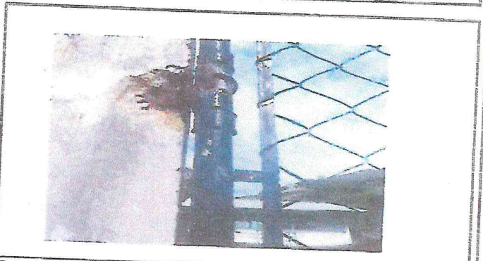
Foto 4: Porton de ingreso principal a la Escuela en mal estado. Previo