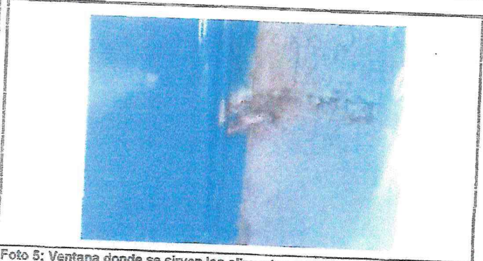
Foto 5: Ventana donde se sirven los alimentos en mal estado. Previo