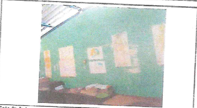
Foto 3: Aula numero 2 donde se atienden todos los grados. Pintura en mal estado. Previo